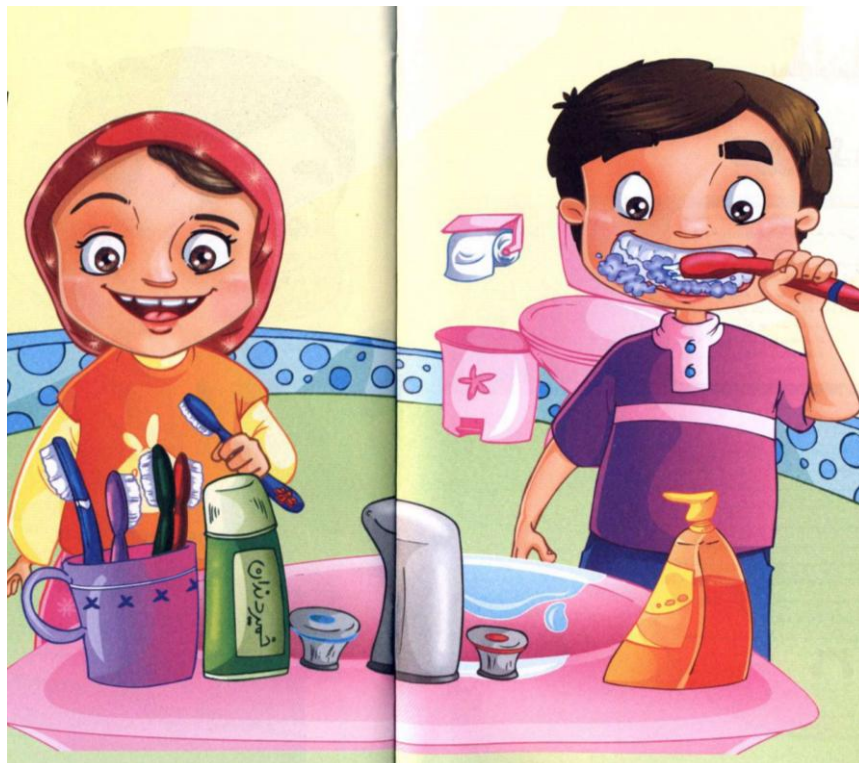
"دندان سالم ، لبخند سالم حتی در بحران"